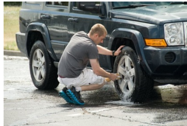
He washes his car every Sunday.