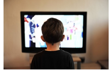
He watches TV everyday.