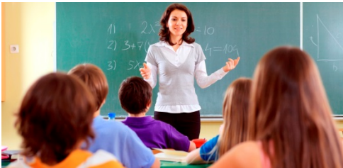
She teaches kids.