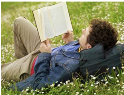
He reads a lot.