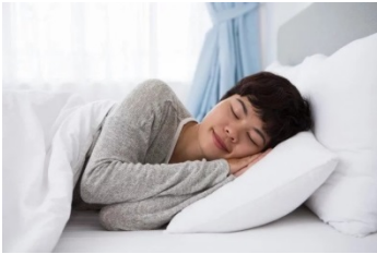
She goes to bed early.

Normalmente, estes verbos terminam em “sh”, “ch”, “o”, “ss” “x” e “z”.