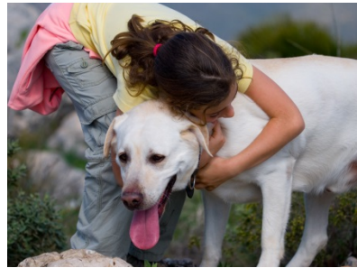
She loves her dog.