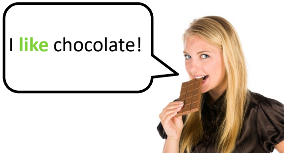
She likes chocolate.

Nós usamos o presente simples quando queremos falar sobre fatos, falar sobre coisas que acontecem rotineiramente e para descrever coisas que são geralmente verdadeiras.