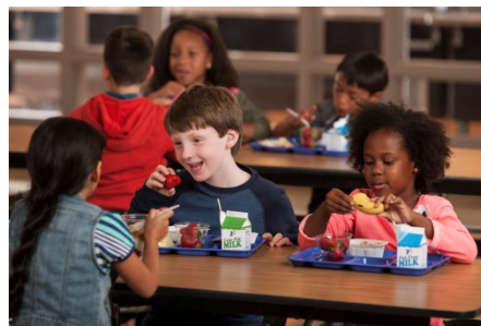
They eat lunch everyday at 12.

Veja abaixo como é a estrutura do presente simples: